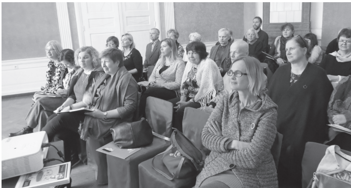
Mulke sügüskoolin Kärstne mõisan olli 24. novembrel saalitäis rahvast kullemen ettekandit mulgi lugudest ja nende korjamisest.